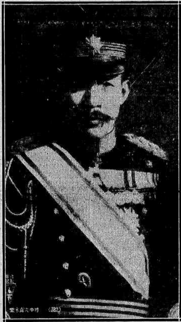
O general Araki

Shanghai, 28 (Havas) — Os circulos militares chineses dão uma importancia especial ao facto do terceiro regimento japonês que foi o